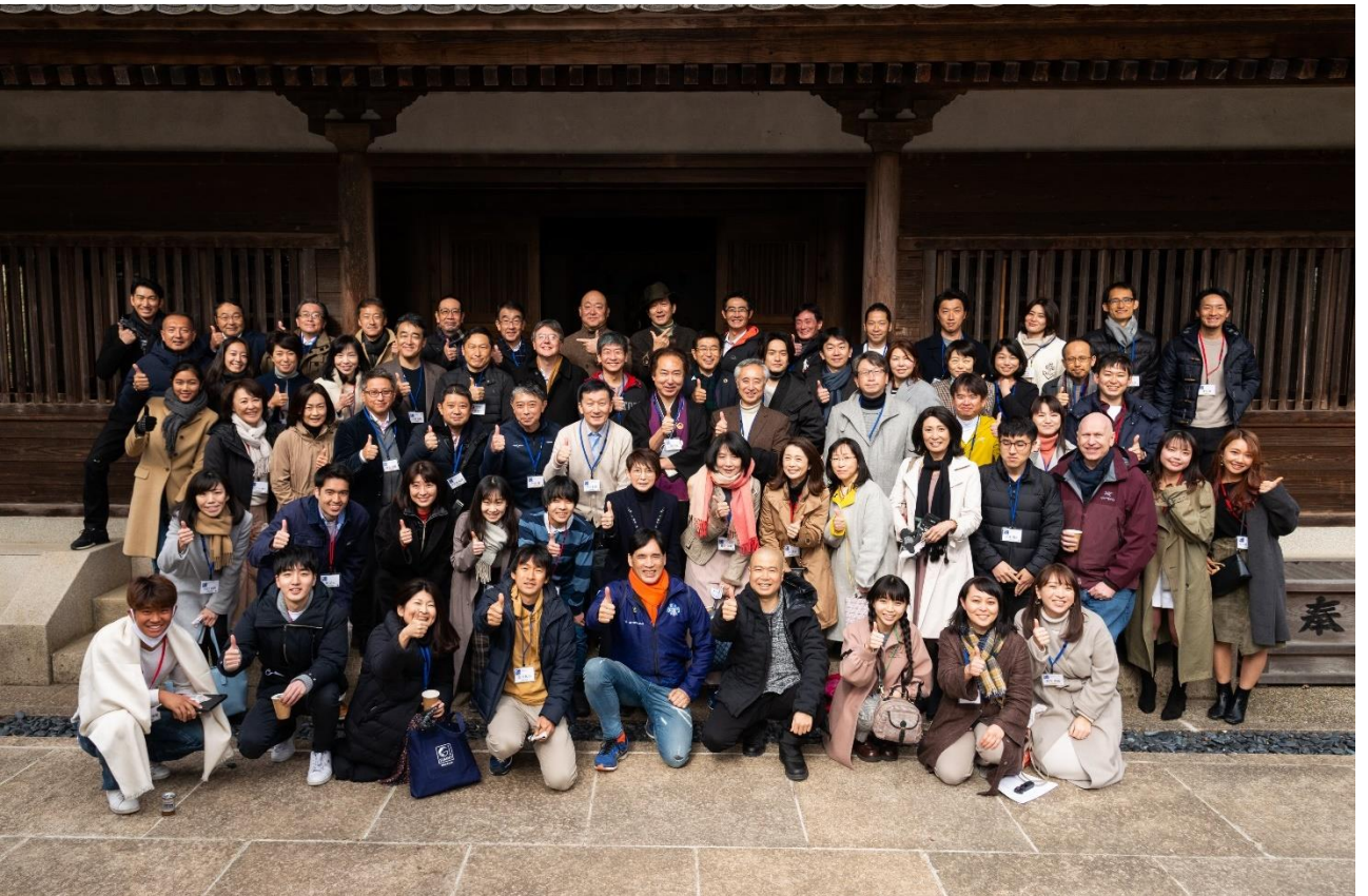
※撮影時のみマスクを外しました