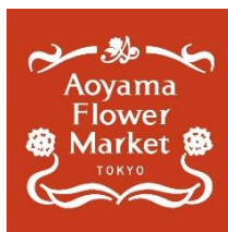
株式会社パーク・コーポレーション