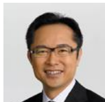
古川 元久 氏