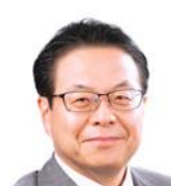
世耕 弘成 氏