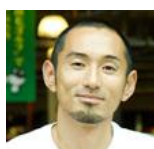
為末 大 氏