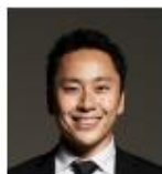
太田 雄貴 氏