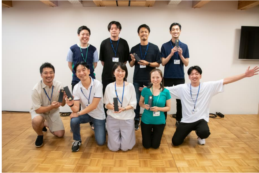
今年ご卒業の皆さん