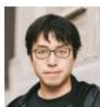
成田 悠輔 氏