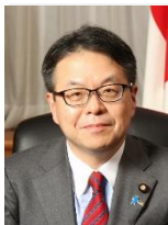
世耕 弘成 氏