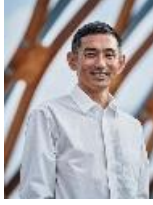
為末 大 氏