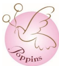
株式会社ポピンズ